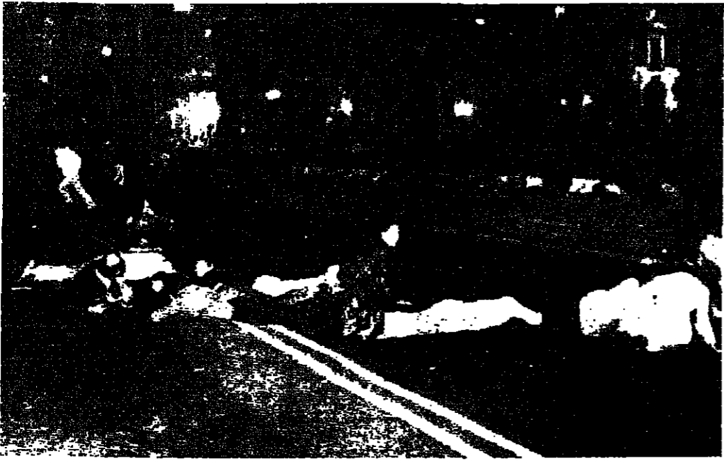
مظاهرون مؤيدون لحكومة البرتغال ، وقد انبطحوا على الأرض تضامياً مع رصاص « البوليس السياسي » اليساري

وقالت المصادر ان الجنرال اليساري اوفيلو دي كارفالهو رفض طلباً قدم اليه ، ويقضي بتدخل قوات الجيش لاطلاق سراح ازويدو الذي اجبر على ملازمة مكتبه لمدة ايام متتالية - ووصفت المصادر تصرف كارفالهو بأنه عدم ولاه ساهم بزيادة من الانقسام الذي تصبى منه القيادة العسكرية . وراى المراقبون في هذه النتيجة انتصاراً تكتيكياً لحملة الجناح اليساري المتطرف الذي يدعو الى حكم شعبي اكثر فعالية يستجيب لتساؤلات السياسة التي تتخاضها المجالس المحلية للجان العمالية . وكانت هذه المجالس قد انشئت على فراخ تلك التي اعقبت الثورة البلشفية في روسيا السنة ١٩١٧ . والارتبنتيجة تلك كنهياً بان الحكومة قد تنقل الى المناطق المحاذية لتفادي خطر اليساريين الذي لا يكاد يتجاوز بعض الاممعة . وكان الجنرال ازويدو قد لجأ الى مل هذا الاحتمال منذ شهر . وكان رد الفعل فوراً في الشمال المحافظ ، فقد اصيب ١١ شخصاً خلال تبادل اطلاق النار في مدينة اوبورتو الحاققة امس الاول ، اثناء الهجوم على اهداف يسارية هناك . لشبونة - ر ، وصراف